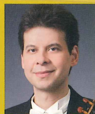
ヘクター・ファルコン (ヴァイオリン)