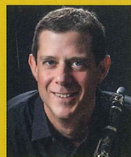
ベンジャミン・バロン (クラリネット)